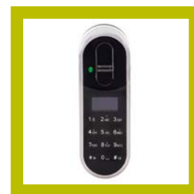
Lecteur Touchpad+ (code et empreinte digitale)